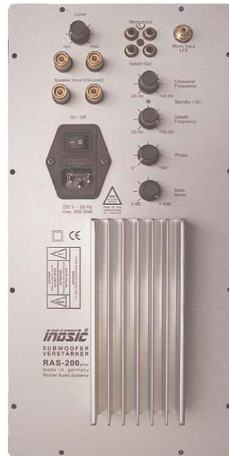
RAS200plus(175 x360 mm)