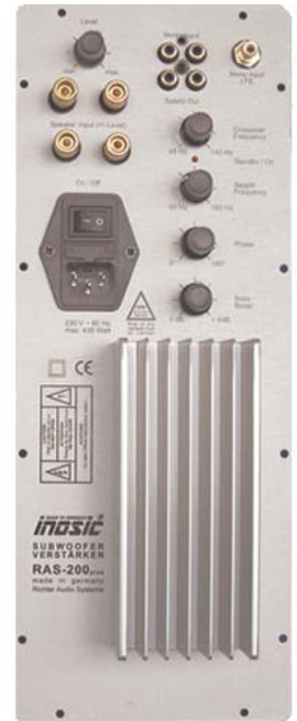
RAS200plus-small (140 x360 mm)